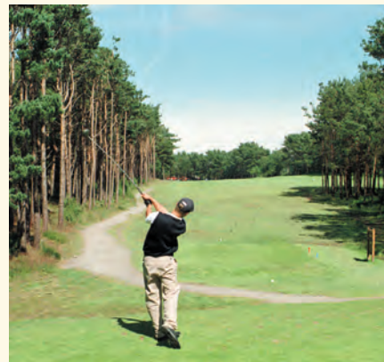
Øvre del av fairwayen og greenen på hull nr. 9 skal ombygges i fase 1