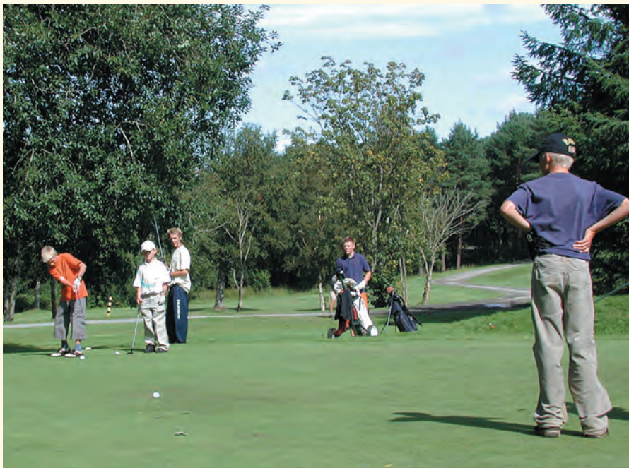
Treningsiveren er stor – kanskje spesielt hos de aller yngste.

konkurrerer om rankingpoeng og en endelig vinner gjennom sesongen. Årets første turnering ble tradisjonen tro avholdt i Stavanger og fortsatte med turneringer på Nes, Asker, Sorknes og finalen for de 16 beste guttene og 8 beste jentene på Losby i begynnelsen av sept. Stavanger hadde gjennom hele sesongen spillere som hevdet seg helt i teten, og hadde tilslutt 5 (4 gutter og 1 jente) spillere som var kvalifisert til finalen på Losby. Dette var flere enn noen annen klubb. Igjen et bevis på at vi ikke bare har bredden, men også toppene i klubben.