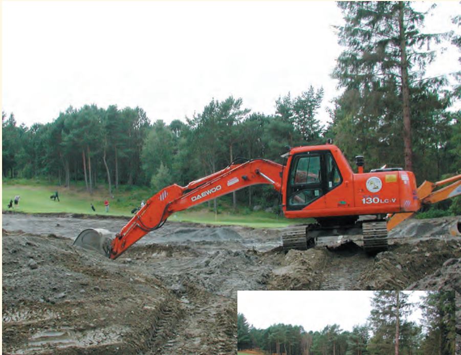
Opp av gjørme og mold (som Fugl Fønix) oppstår det nye Hull nr.1. Speeeenende!

Det ekstraordinære årsmøtet i september besluttet enstemmig at banen skal utbedres. Fase 1 blir igangsatt i vinter, med unntak av green nr. 1, som allerede er opparbeidet og ferdiggjort. Medlemmene har tatt en meget viktig prinsipiell beslutning mht hvilken standard vi ønsker på banen vår. Både beslutningen om å bygge nytt verksted og den om utbedring av banen viser at vi ønsker at pengene skal tilbakeføres til anlegget. Det virker som de fleste medlemmene har en realistisk forventning til kvalitet og økonomisk ramme for de fremtidige prosjektene. Men det er viktig at klubben finner en balansert fremdrift hva angår omfang og økonomi. Vi blir nødt til å trekke erfaringer fra igangsatte prosjekter før vi retter blikket videre.