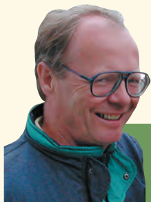
Rolfs HCP- spalte