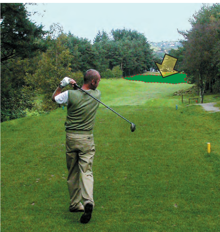
Fra hull 14. Arbeidet med å utbedre midtpartiet på fairwayen ved mot veien starter muligens opp denne vinteren

Styret skal i høst ta stilling til om banekomiteen kan sette sine planer om utbedring av deler av fairwayen på hull 18 og hull 14 ut i livet allerede i vinter. Det kan bety at det i sesongen 2004 ikke blir arrangert noen forbundsturneringer på SGKs bane.