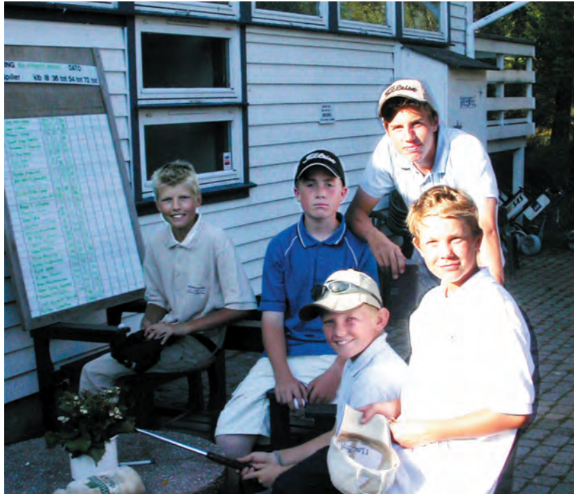
Juniorene viste godt igjen i årets KM. Mange av disse vil vi ganske sikkert finne høyt oppe på listene i fremtidige KM og i andre turneringer. Men jentene må med!

Sesongen viser at klubben har mange unge lovende spillere på gang. Selv om vi mangler nasjonale toppresultater, viser det seg at det gror godt i de yngre rekkene. Gjennom det nye opp- og nedrykkssystemet mellom A- og B-tur hvor det er regionale B-turer, har Stavanger vært den dominerende klubben på Sør-Vestlandet. I løpet av sesongen har vi fått 5 nye spillere med A-tur erfaring med til dels svært tilfredstillende resultat. Vi ser også fra C-tur at Stavanger er den dominerende klubben i distriktet når det både gjelder topp og bredde.