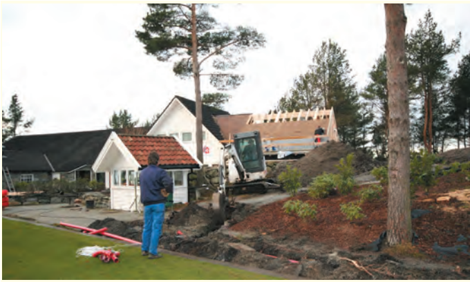
Banemannskapet i ferd med grøftegraving for kabler

I forbindelse med det nye tilbygget gjennomgår i disse dager også plassen rundt klubbhuset og teestedet på hull 1 og 10 en formidabel ansiktsløftning