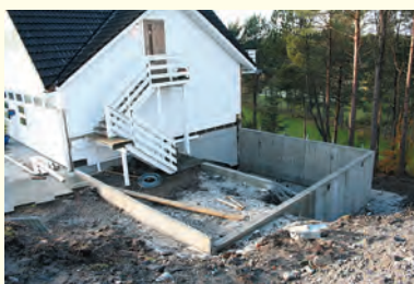
Grunnmuren til det nye tilbygget sto ferdig så sent som midten av november.

Det bankes og hamres og graves til den store gullmedaljen – det er full aktivitet hele dagen i og rundt klubbhuset vårt. Arbeidet med reisverket til det nye tilbygget startet i oktober og både ekstern byggmester og banemannskap deltar i forvandlingen av klubbhuset.