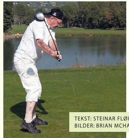
TEKST: STEINAR FLØISVIK BILDER: BRIAN MCHATTIE