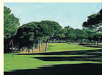
The Old Course

Fem av de seks kursdagene var det to ganger 45 minutter golf-skole, med instruksjon i alt fra bunkersslag, chip, pitch og putt