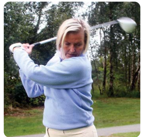
Brit Lea treffer også ballen svært så bra!

Begge setter også pris på å snakke med folk fra mange andre klubber og høre hvordan de håndterer og prioriterer.