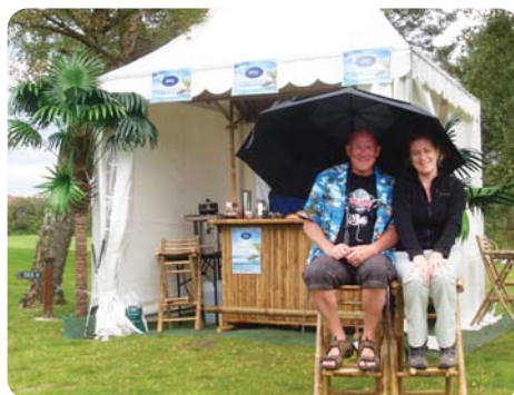
Skikkelig sydenstemning og baluba på hull 8!