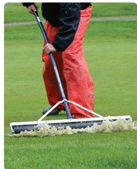
NM 2007, oversvømmelse på greenene!

vann av oversvømte greener etter et kraftig regnvær. Etter ombyggingen tåler våre sandgreener store mengder nedbør uten å oversvømmes. Sanden drenerer vekk fuktigheten i en fei, og det er også det som er hensikten og spesielt viktig i forbindelse med store turneringer. Vi kan heller ikke ta høyde for den ene ekstremvinteren, vi må planlegge etter det som er normalt for disse kanter av landet.