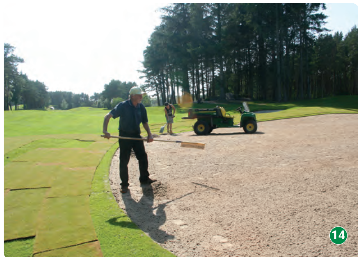
Under: Nylagt green! Nå er det viktig med vanning – hver dag – og senere skal greenene dresses (for hånd) for å jevne dem ut mest mulig etter hvert som gresset grov.