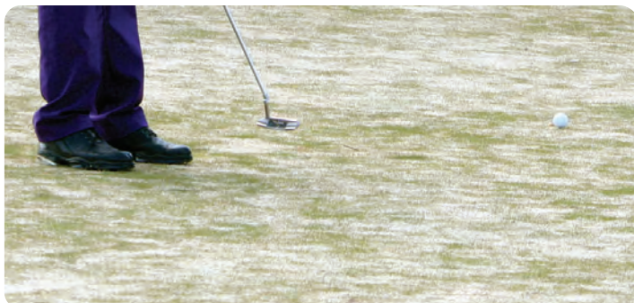
5 mai: Ennå litt tele igjen i sandlaget under torven. Slik så de fleste greenene ut (og verre) rett etter åpning av sesongen – store felt uten gress.