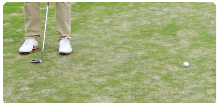
18. mai: Telen er så vidt ute av sandlaget. Gresset har tatt seg litt opp, men mangler struktur og er tynt og ujevnt.