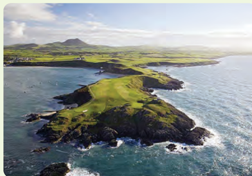
Idylliske Nefyn golfbane utenfor Gwynedd, Wales