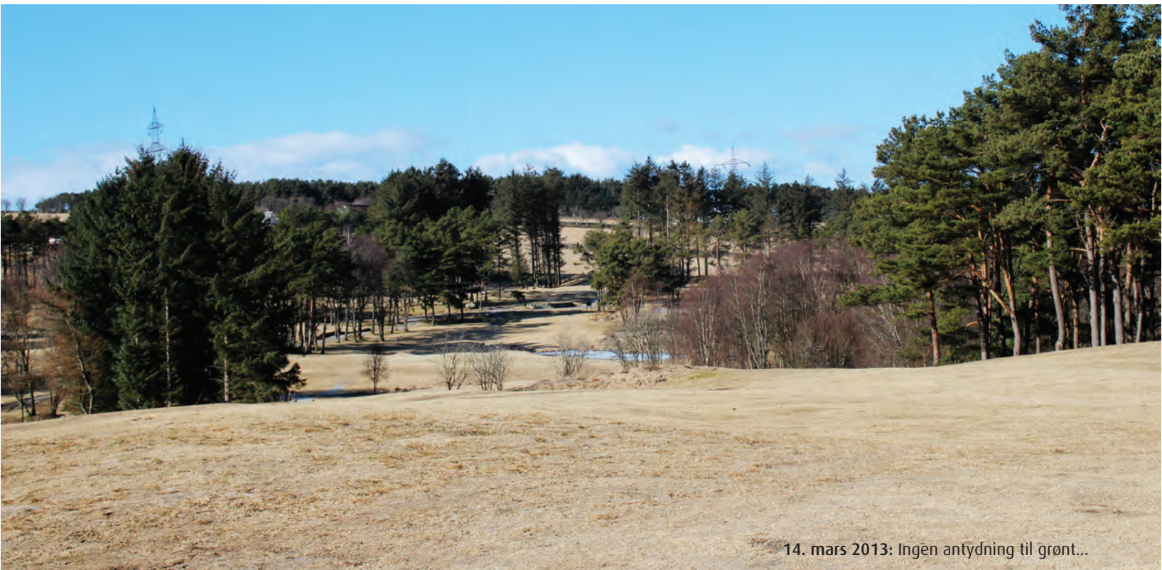
14. mars 2013: Ingen antydning til grønt...