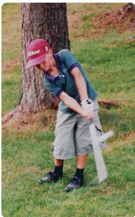
Ole var hekta allerede fra 5-års alderen