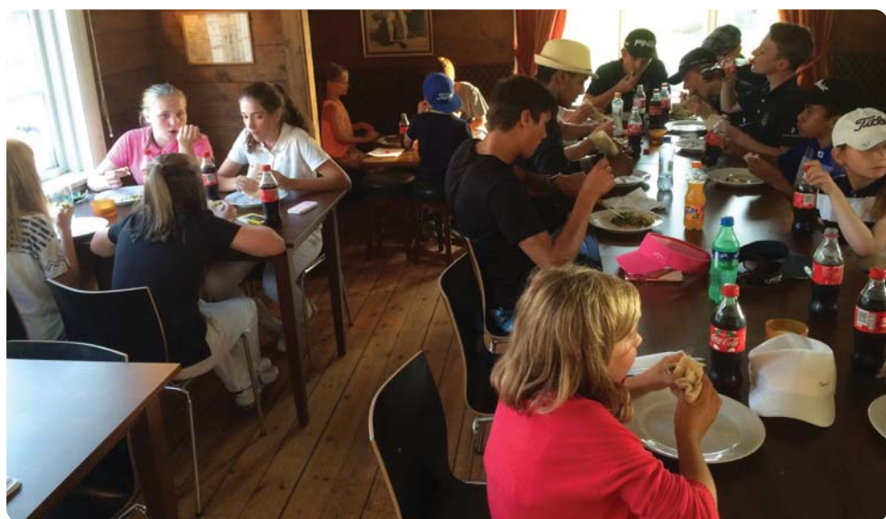
Taco-kos og premieudelig etter Juniorscambelen er meget populært.