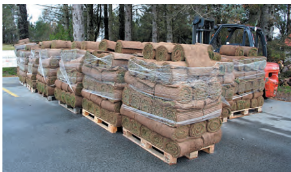
Torven kommer hele veien fra Slovakia. Det er ikke få paller som må til