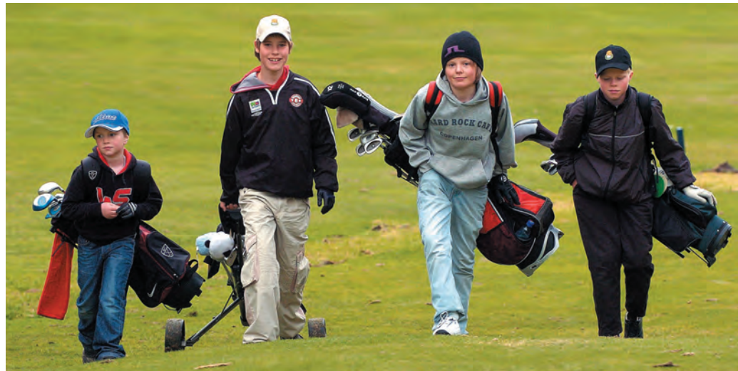
Kjække juniorer med felles interesse golf

Vinterens høydepunkt har uten tvil vært treningsleiren i Portugal. Her legges mye av grunnlaget for en god sesongstart med et omfattende daglig treningsprogram som inneholder trening på range og nærspilsområde samt banespill.