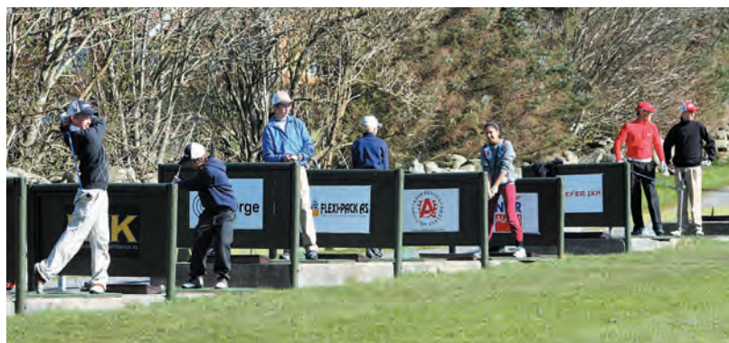
Iherdig oppvarming på drivinrangen før Super-Weekend i april