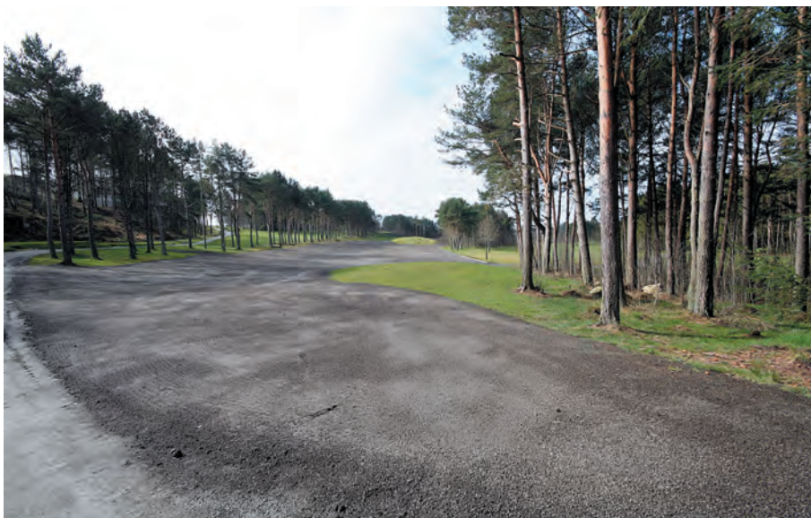
Når drenering er på plass, blir jord kjørt på, og fairwayen blir shapet og formet etter godkjent layout fra fra Niblick Golf Design AS