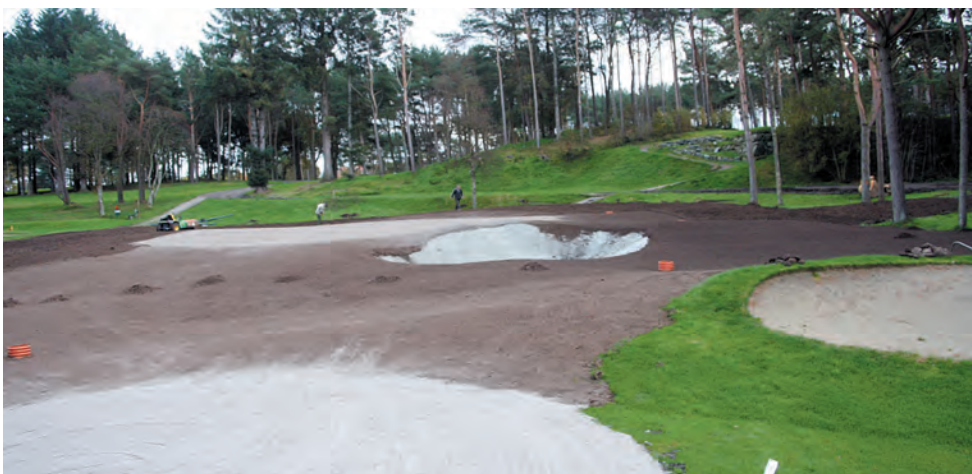
De nye bunkrene foran greenen har fått sin utforming - nå gjenstår bare ny torv ellers på greenen og området rundt. Og vips! var det gjort! Det er ikke mange som fra nederste bilde av ferdig green ville tro at den for en dag og to siden var anleggsområde