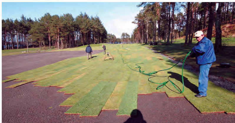
Torvdekket trenger mye vanning for å sette seg. Leif gjør klar til en omgang med slangen