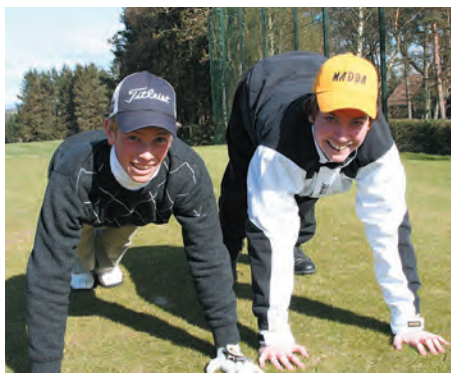
Her får vi en demonstrasjon på en av de ikke altfor "femi" yogaøvelsene