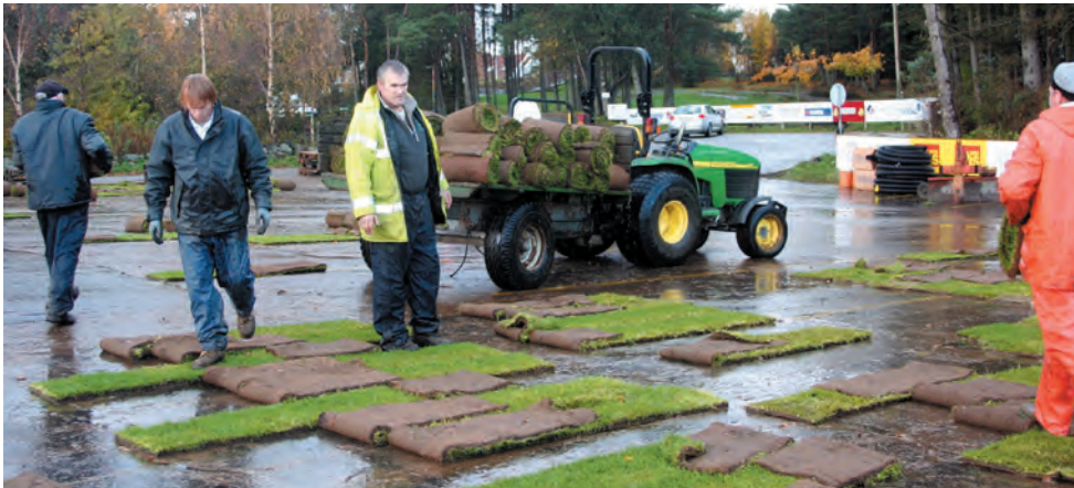
Nok en dag med pøsregn – den blytunge, gjennombløte torven lastes opp på traktoren og fraktes til hvile på 2. og 13. green

Til tross for mye dårlig vær i vinter lyktes det å få gjennomført ombyggingen av 2. og 13. green som planlagt. Men det er ikke det eneste som har stått på agendaen siden vi satte siste putten ved sesongslutt 2006 (se oversikt under), og litt arbeid vil det også bli i løpet av sesongen 2007: