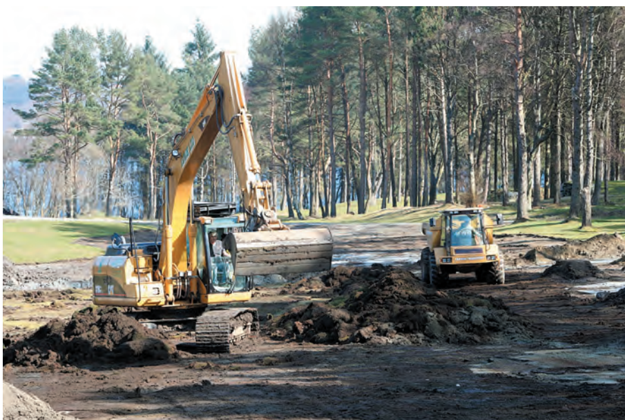
Det øvre kompakte jordlaget, det som har hatt problemer med å drenere skikkelig, blir skrapet bort