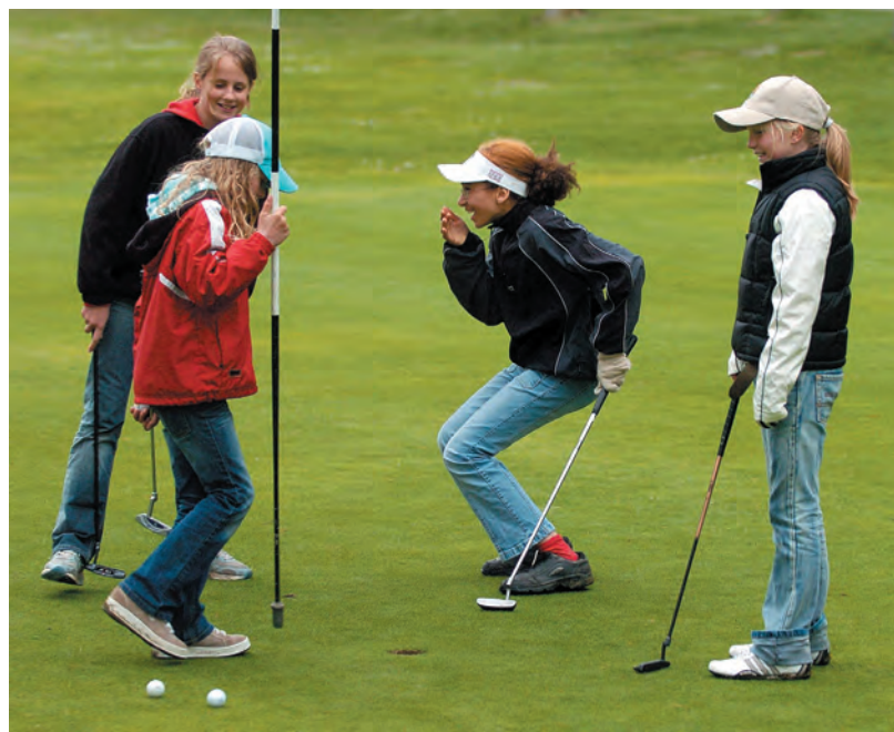
SGK satser på jentene!

Suzann Junior Challenge er en landsdekkende turnering for spillere i aldersgruppen 11 til 16 år. Det spilles først en klubbkvalifisering, så finale i turneringsområdet og til slutt en landsfinale. Deltakerne på landsfinalen får da også møte Suzann Pettersen, som har gitt navn til turneringen. De yngste spillerne, 11 og 12-åringene, spiller stableford med like mange tildelte slag hver, mens resten av startfeltet spiller slagspill uten handicap. Junior NM på egen klubb blir selvsagt et sportslig høydepunkt for oss i år. Turneringen spilles 28.–31. juli. Junior- og elitekomiteen har stor tro på at mange av spillerne på startlisten står oppført med Stavanger Golfklubb som hjemmeklubb.