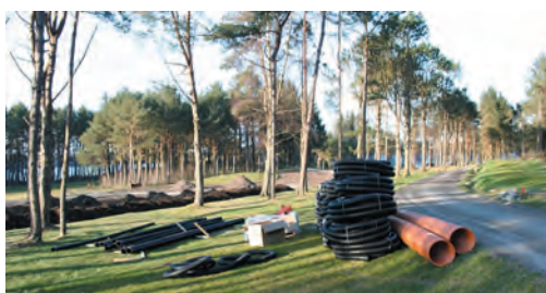
Det er ikke få meter med rør og ledninger som nå skal sørge for en mye bedre drenering

Bare kosmetikk? I så tilfellet er det snakk om svært dyptpløyende kosmetikk – ja, faktisk, en skikkelig ansiktsløfting! For det er ikke småtterier av arbeid som har pågått i vinter, og fremdeles pågår når vinterstive golfere inntar SGKs baner ved sesongens begynnelse. Det har vært en stadig dur av gravemaskiner og trucker, jord er blitt ende-ventd og kilometervis med drenering er lagt. Meter på meter med torv har funnet sitt endelige hvilested etter en strabasios reise i kjølecontainer fra Slovakia til golfbanen ved Store Stokkavatn.