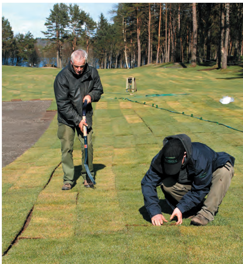
Å legge torv er rene håndarbeidet når den siste tilpasningen skal til. Dette er noe karene fra Niblick Golf Design er meget nøye med - sømmene mellom torvene skal vises minst mulig

Og uansett – vi har all grunn til å glede oss!