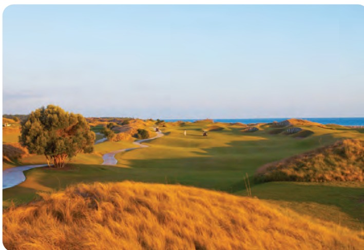
Kveldssol over Lykia-banen