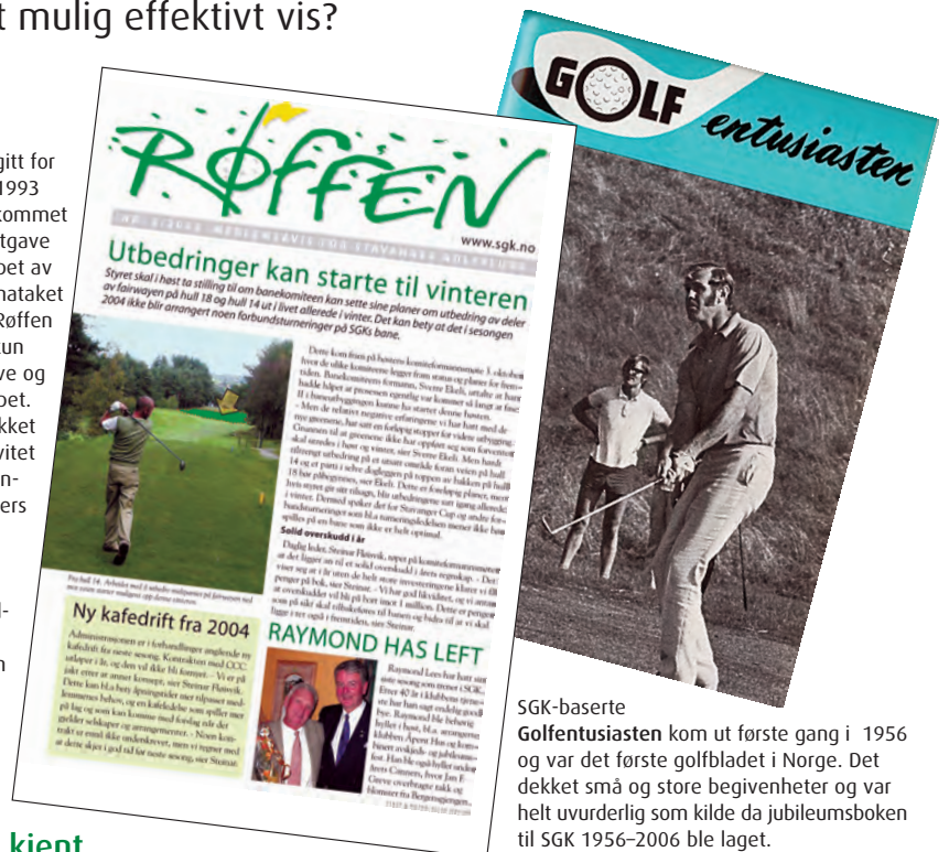
SGK-baserte Golfentusiasten kom ut første gang i 1956 og var det første golfbladet i Norge. Det dekket små og store begivenheter og var helt uvurderlig som kilde da jubileumsboken til SGK 1956-2006 ble laget.

Juniorsatsingen helt fra 1970-årene har plassert oss blant lederne i Norge. Er vi egentlig klar over, de fleste av oss, hvor gjeve resultatene er, med VM og EM og noe så utrolig stort som en seier i en amerikansk turnering? Når vi ser på profil og informasjon, må dette opplagt med, og være så tydelig at reaksjonen er der med én gang vi kommer inn i klubbhuset: "Ja, dette er MIN klubb!"