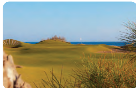
Fra Lykia Links Golf Resort