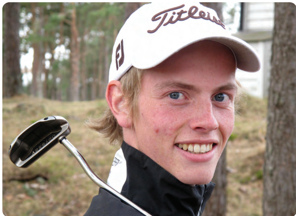
Oles putter viste seg fra sin beste side hele turneringen

i Florida denne førjulsdagen i desember 2009.