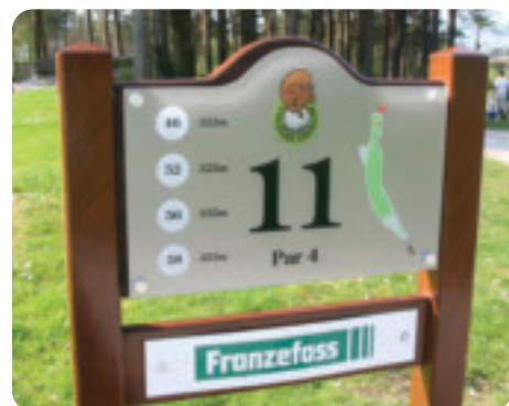
Fra 5. mai kan du velge banelengde – ikke farge

Hei alle medlemmer - kom ut, se – og spill på vår unike og nydelige bane der greenkeeper, banemannskap og en mengde frivillige har gjort en fantastisk innsats i vinter. – Og for aller første gang i historien skal det ikke lenger spilles fra hvite, gule, blå eller røde teebokser. Fra 5. mai er banen kjønnsnøytral og inndelt i lengder: 46, 52, 56 og 58. En rekke hull er blitt kortere – og banen fremstår trolig som enda mer innbydende og spennende – for alle kategorier golfere. VELKOMMEN!