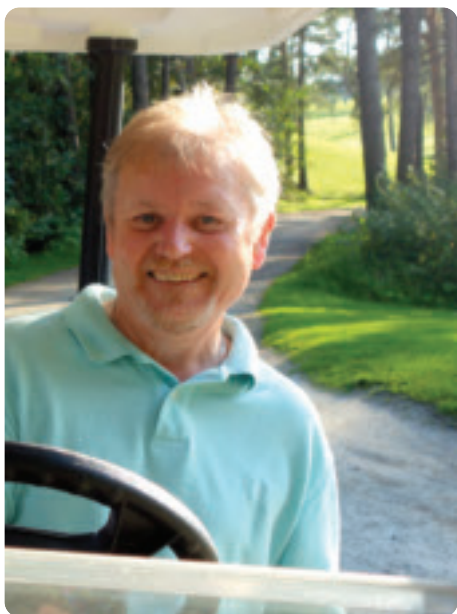
Fraser i farta mellom proshop og treningstimer