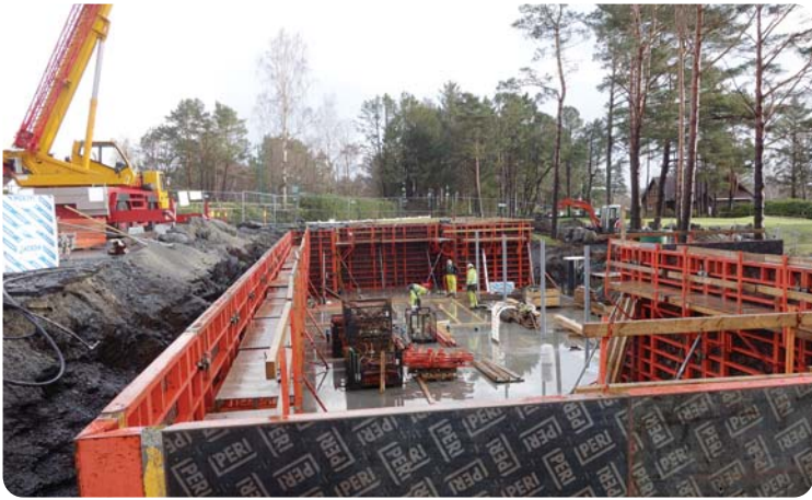
Veggene skal opp, og en omfattende forskaling må til før betong skal fylles i.