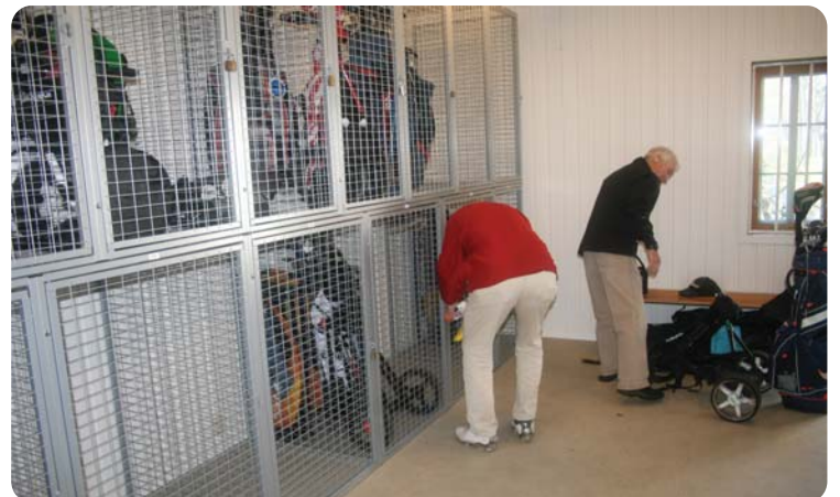
Begynnelsen av mai: Tralleskapene er i bruk og tilbakemeldingene er gode!