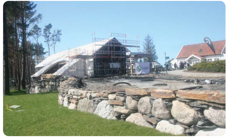
Den nye puttegreenen med den flotte muren begynner å ta form.