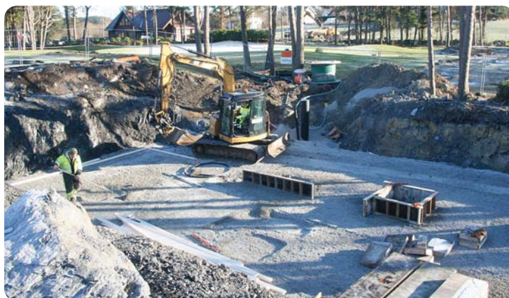
Tomten er utsprengt og "sålen" blir tilført sand og jevnet ut.