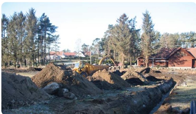
Grøfter må graves til tomten slik at kabler og ledninger kan ligge frostfritt.