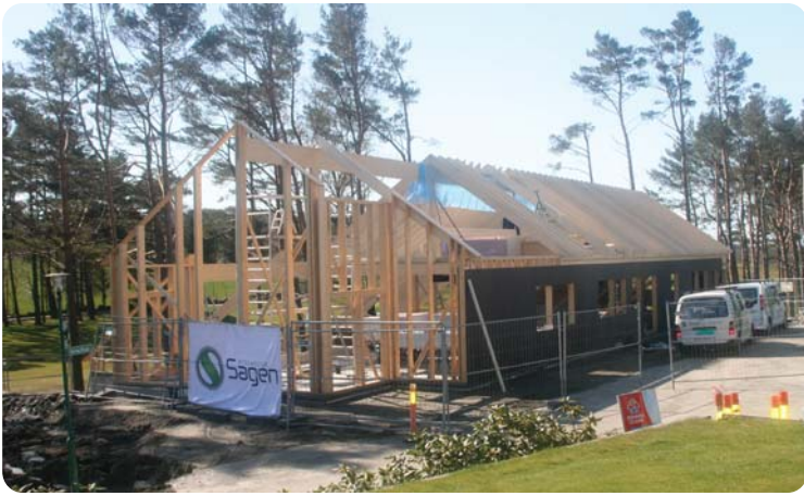
Reisverket er oppe, nå skal vegger og tak tettes.