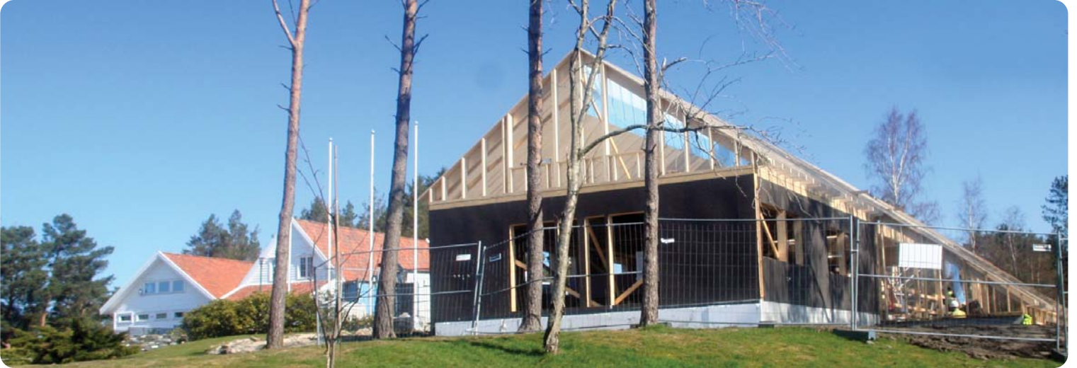
Det er i beynnelsen av mai - vårt nye aktivitetshus er reist - her sett fra området mellom green 18. og hull 9.