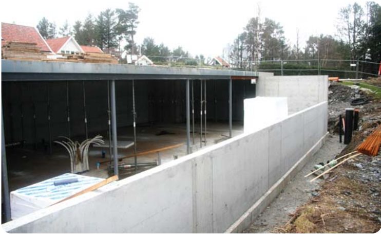
Underetasjen har nå fått tak og solide vegger.