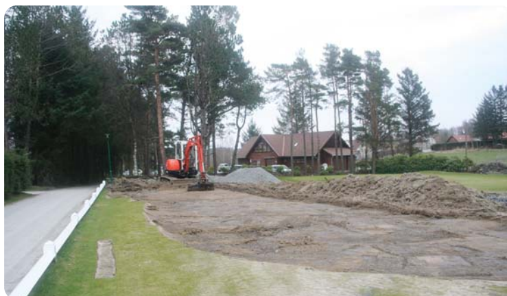
Farvell, gamle puttegreen - nå skrelles jorden av for å gi plass til en ny.