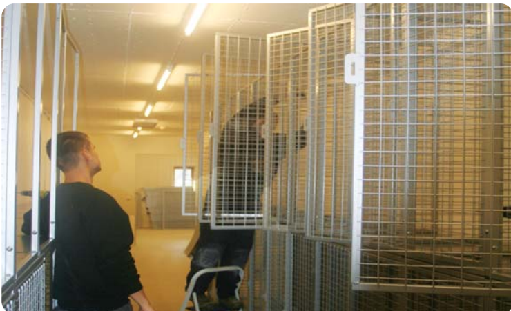
De nye tralleskapene monteres i nymalte rom, ca. 310 stk. skal på plass