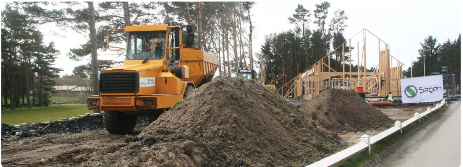
Bygget reiser seg, og den nye puttegreenen begynner å ta form. Mange lass med gammel jordmasse er skrelt av og kjøres bort.