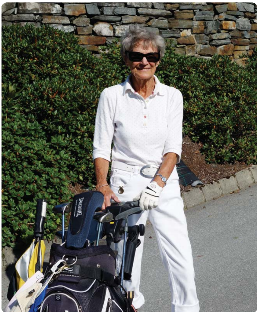
På vei til eller fra en kjekk golfrunde - klubbens nydelige Grand Old Lady blir aldri gammel!