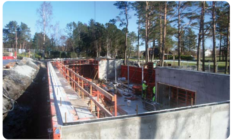
Når betongen er stivnet, fjernes forskalingen, og murveggene kommer frem.