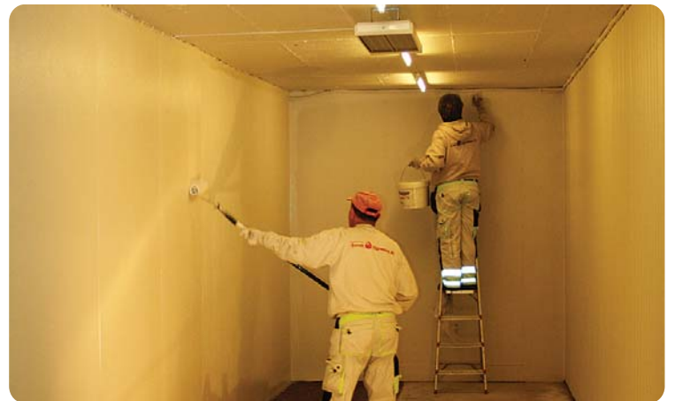
Her males det i den gamle herregarderoben