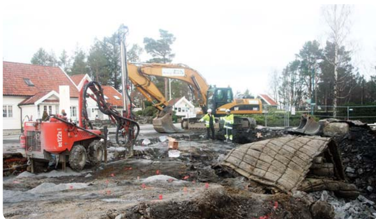
Sprenging og meisling må til for å klargjøre tomten.