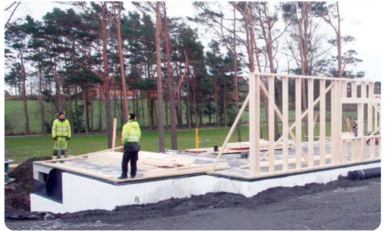
Nå går det fort med reisverket til veggen mot gårdplassen.