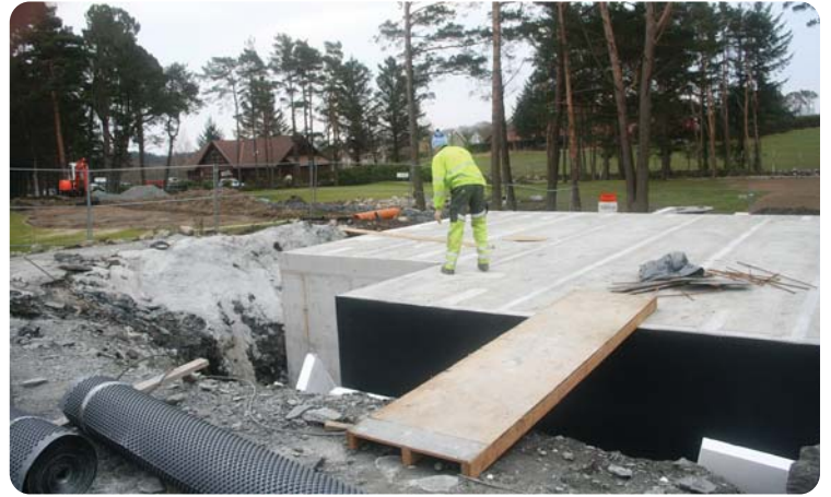
Isolerende gipsplater kommer på toppen av bjelkelaget.