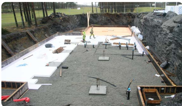
Gipsplater legges i rammen for isolasjon før gulvet skal støpes .