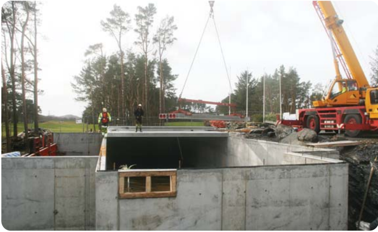
Stålbjelker til gulvet i 1. etasje (tak i u.etg) heises på plass.