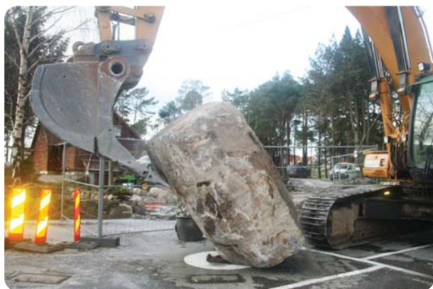
Forsiktig, forsiktig manøvreres den store ruggen på plass.