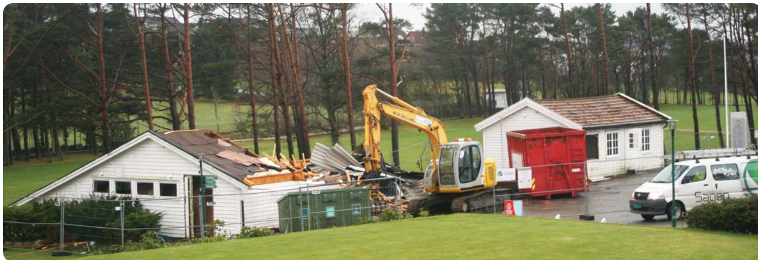
Takk for alt til trallehuset, som har rommet medlemmenes golfutsyr helt fra 1964. Siste farvel også til juniorhuset som har vært en del av klubben 1957.